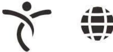
Gambar 1.5 Entrepreneurship & Global

Entrepreneurship dan Global memiliki makna mencetak entrepreneur skala global. UDB bertekad untuk menciptakan lulusan yang tidak hanya memiliki pengetahuan, keterampilan dan teknologi, namun juga jiwa leadership, karakter mandiri, sehingga tidak hanya siap di dunia kerja namun berani menciptakan lapangan pekerjaan (menjadi entrepreneur handal) yang kemudian sanggup bersaing dalam skala global). Lambang Global memiliki warna emas yang memiliki arti prestasi, kesuksesan dan kemenangan.